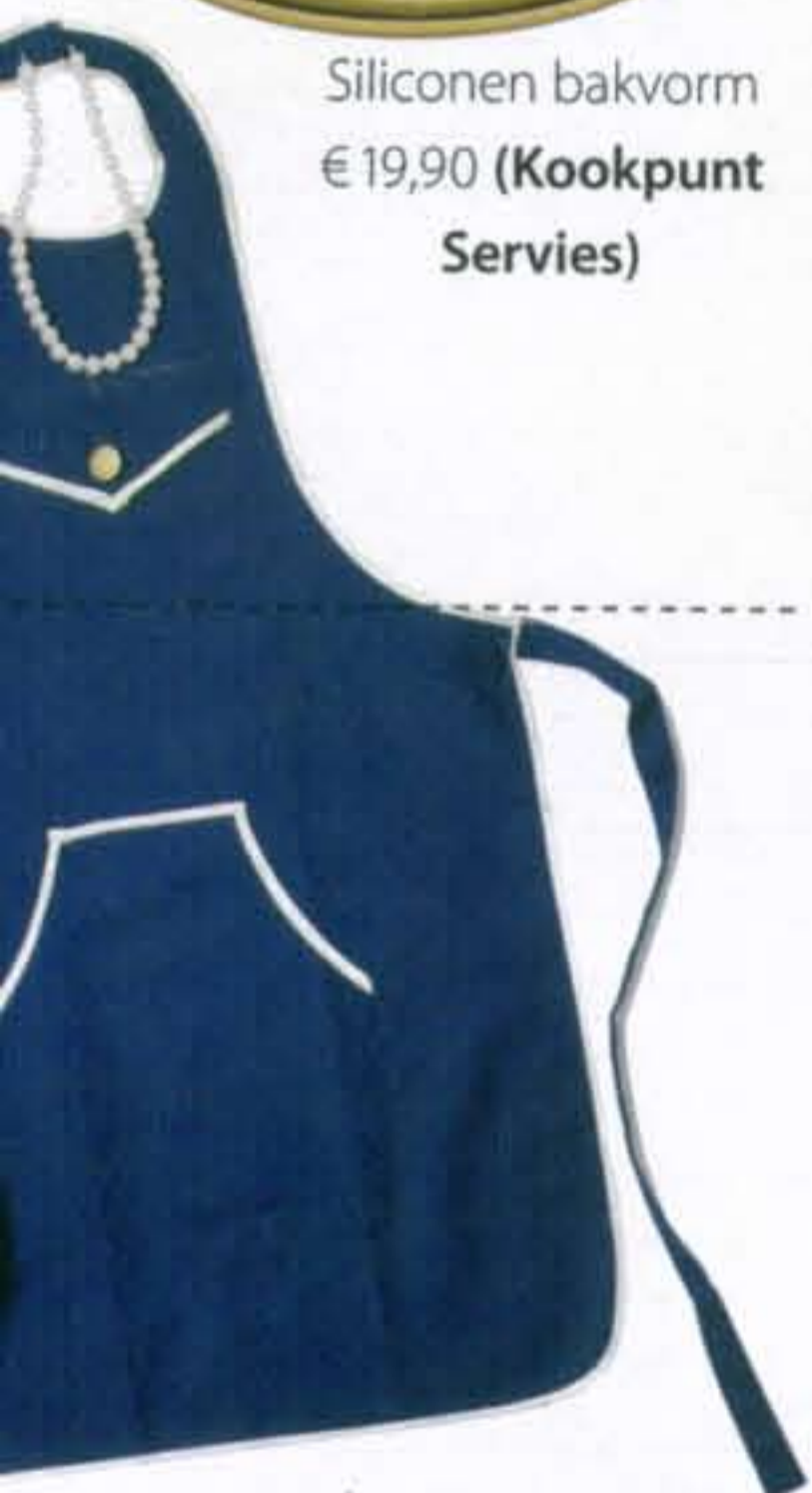
Schort met parelketting € 21,90 (Cool Cooking via Kookpunt Servies)