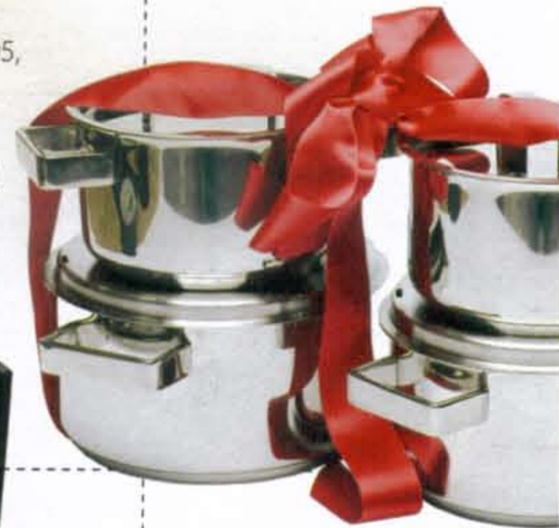
Kookpan 16 cm € 30,95, 18 cm € 33,95, 20 cm € 36,95, steelepan met deksel € 28,95 (Hema)