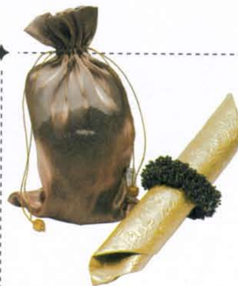
Zakje met servetringen € 33,- (Kookpunt Servies)