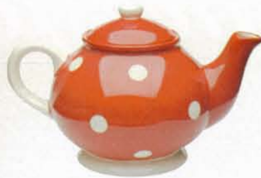
Rood met witte stippen theepot € 23,50 (Jan)