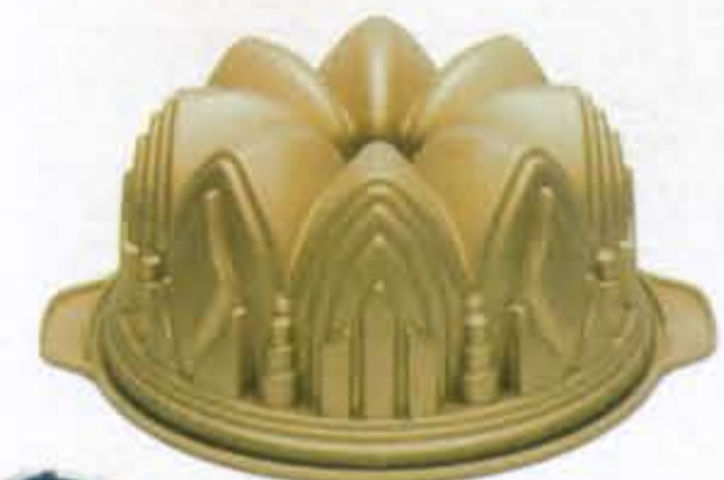
Siliconen bakvorm € 19,90 (Kookpunt Servies)