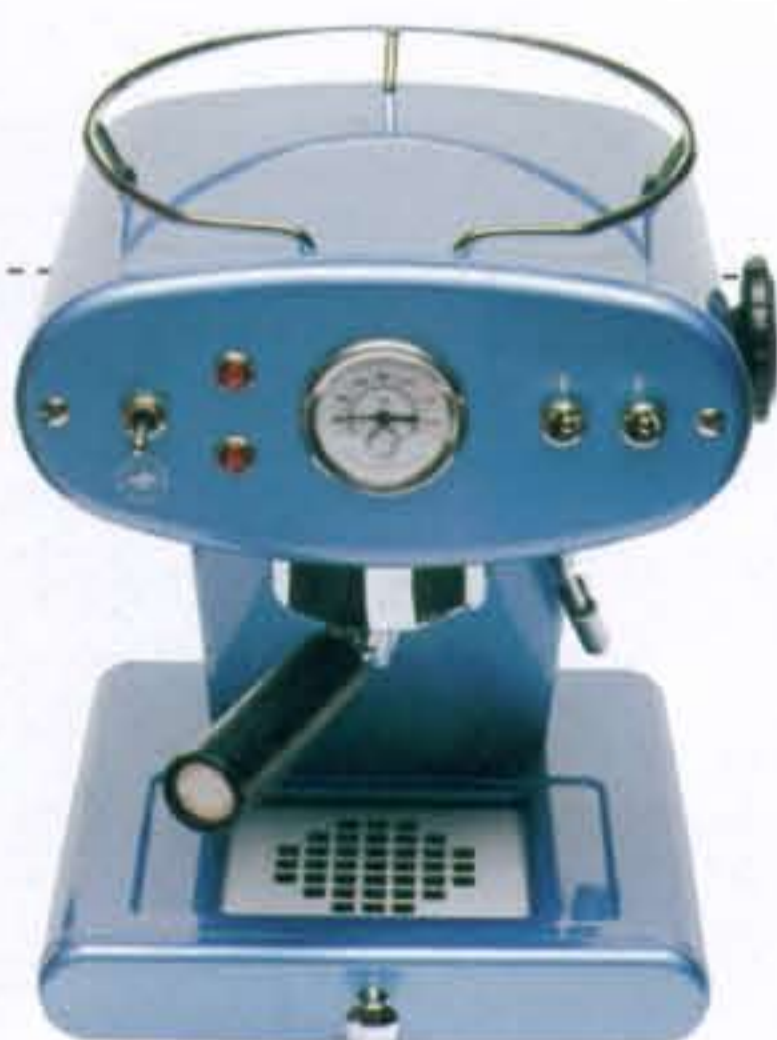
Espressoapparaat € 569,- (Illy Francis via Kookpunt Espresso)