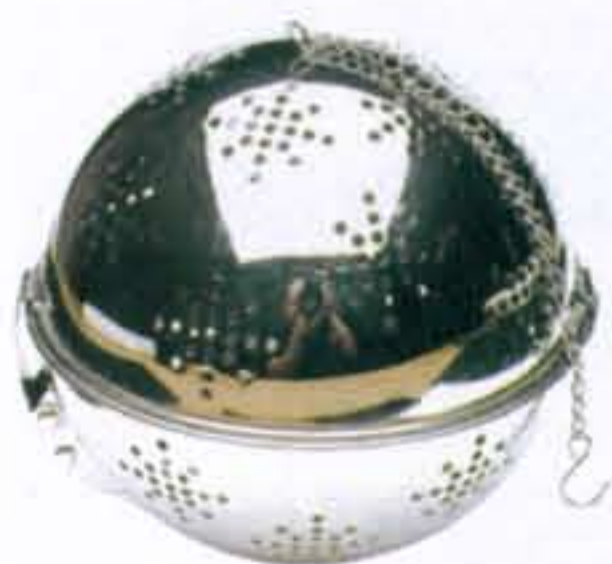
Rijstbal om rijst in te koken € 25,40 (de Bijenkorf)