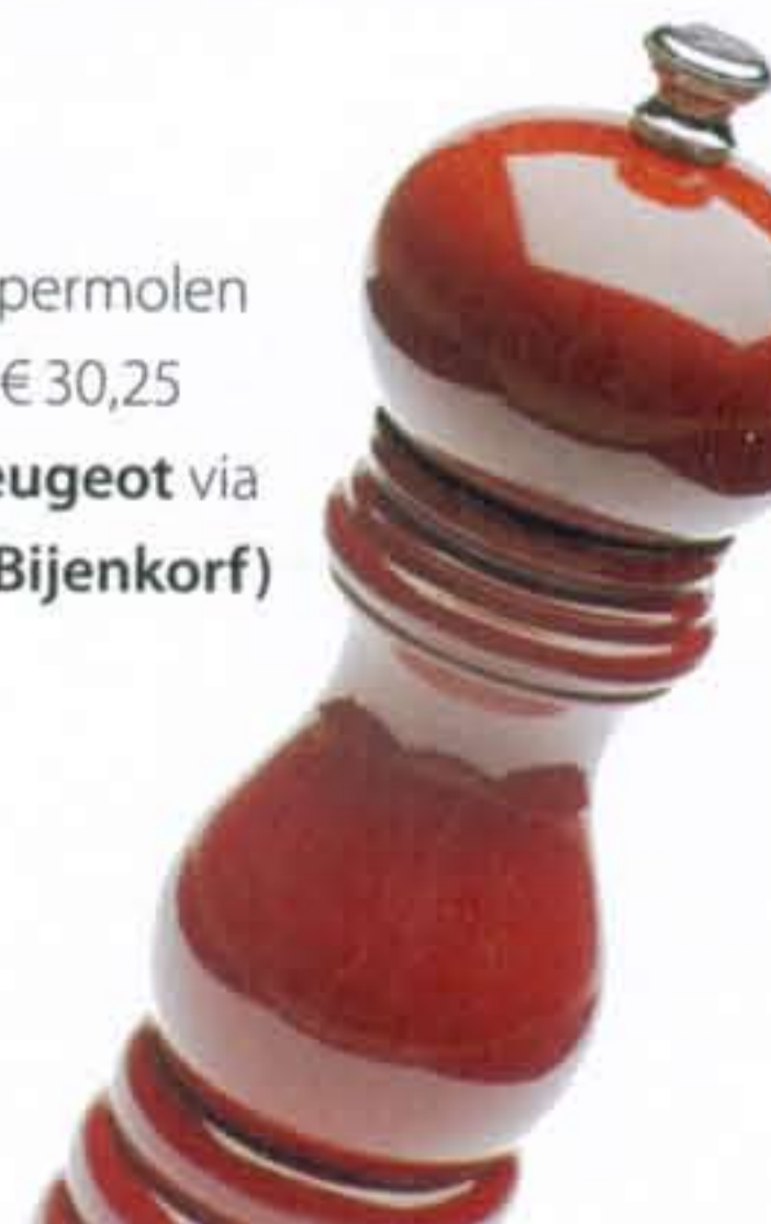
Pepermolen € 30,25 (Peugeot via de Bijenkorf)