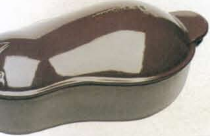
Ovenschaal in de vorm van een aubergine € 122,- (Le Creuset via Kookpunt Kookgerei)

Het is natuurlijk niet waar het om draait bij Kerstmis. Maar toch hoort het er een beetje bij: