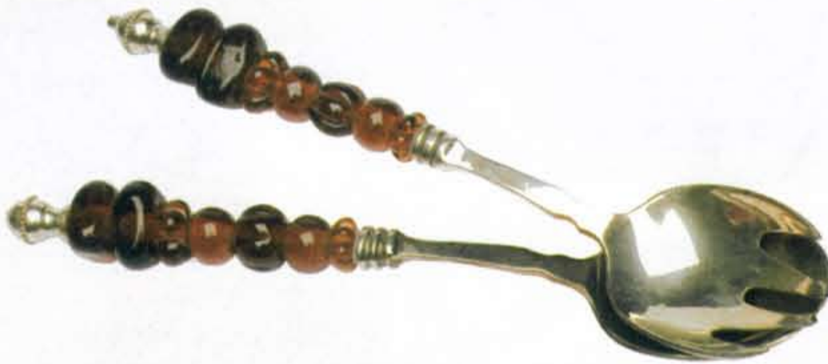
Saladebestek met decoratieve stenen € 22,50 (Kitsch & Kunst)