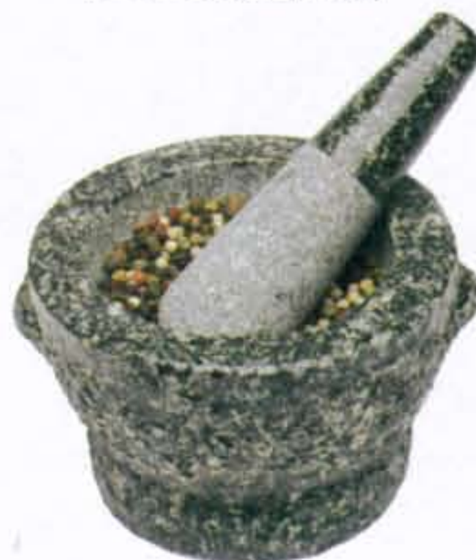
Granieten vijzel € 24,50 (Dille & Kaamille)