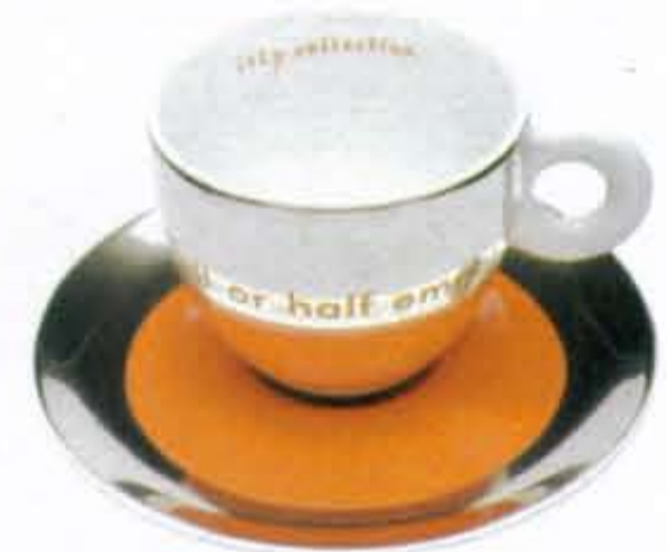
Espressokopje als set € 59,- (illycaffè)