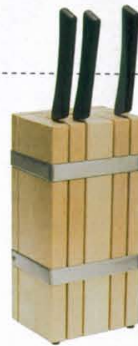
Messenblok € 7,95, messenset € 1,25 (Ikea)