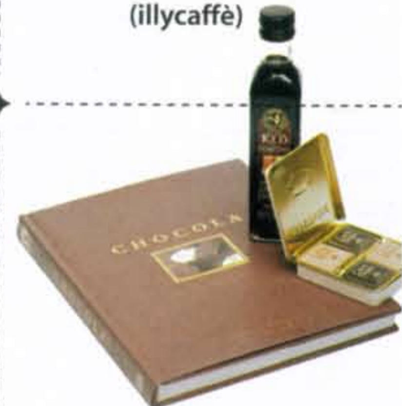
Chocoladesiroop voor de koffie € 4,99 (Intratuin 's Gravenzande), chocoladekookboek € 19,95 (ISBN 9059200756), doosje met chocola € 3,95 (Dille & Kamille)